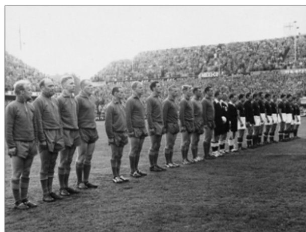
Sverige möter Ungern på Råsunda den 12 juli 1958.

Reklam för fotbollsöl på en buss som kör runt i trafiken hade alltså varit något helt otänkbart idag. Alkohol får inte förknippas med vare sig trafik eller sport. Dessutom är alkoholreklam idag bara tillåtet på fordon som är ”nödvändiga för den verksamhet som näringsidkaren bedriver” – alltså absolut inte på en buss.