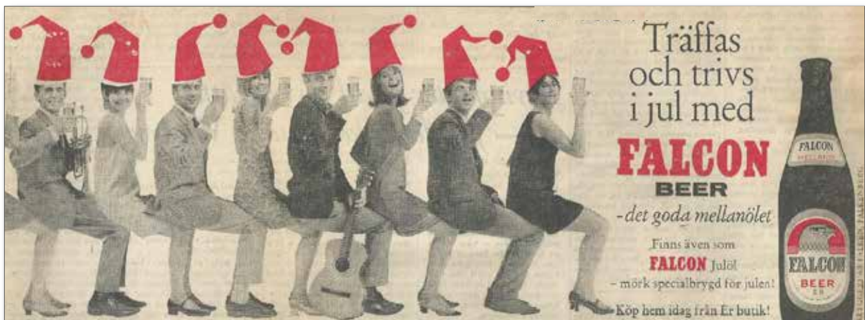
Annons från Hallands Nyheter 7/12 1966

Samtidigt vill min hustru och jag önska er alla en God Jul och Gott Nytt År!