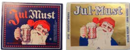
Två tomtar från Norrland

Nu har ett liknande exempel kommit till redaktionens kännedom. Även denna gång handlar det om Tartu bryggeri som verkar ha inspirerats av svenska jultomtetiketter.