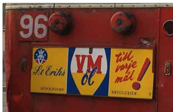
Allt som på något sätt förknippades med fotbolls-VM såldes som smör i solsken sommaren 1958, inte minst öl.